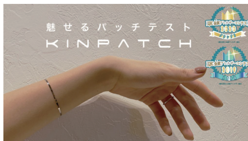
コンセプト部門部門 グランプリ 「魅せるパッチテスト KINPATCH」